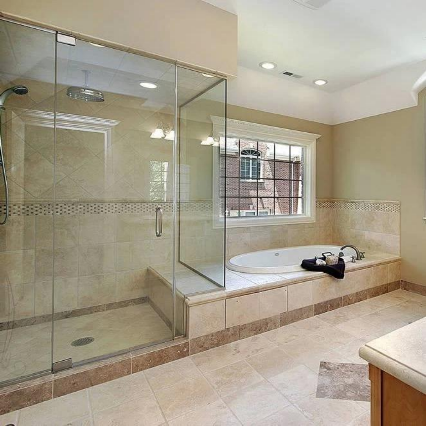
: صور من الزجاج الشفاف 6 مم