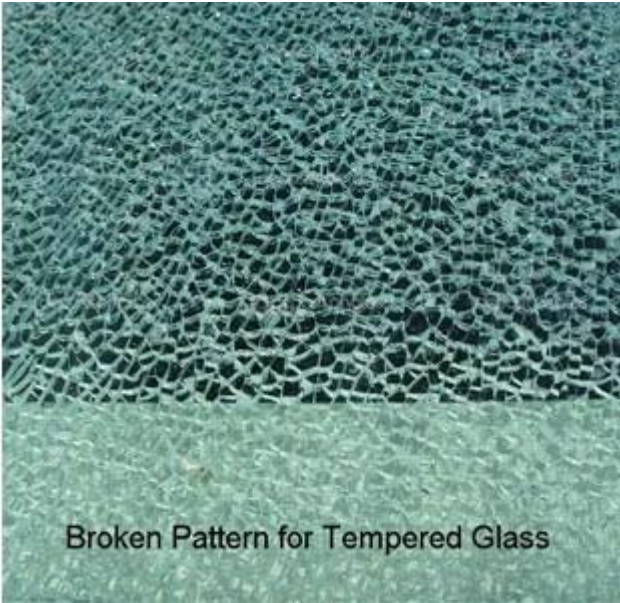
Broken Pattern for Tempered Glass