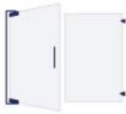
Pivot Shower Doors