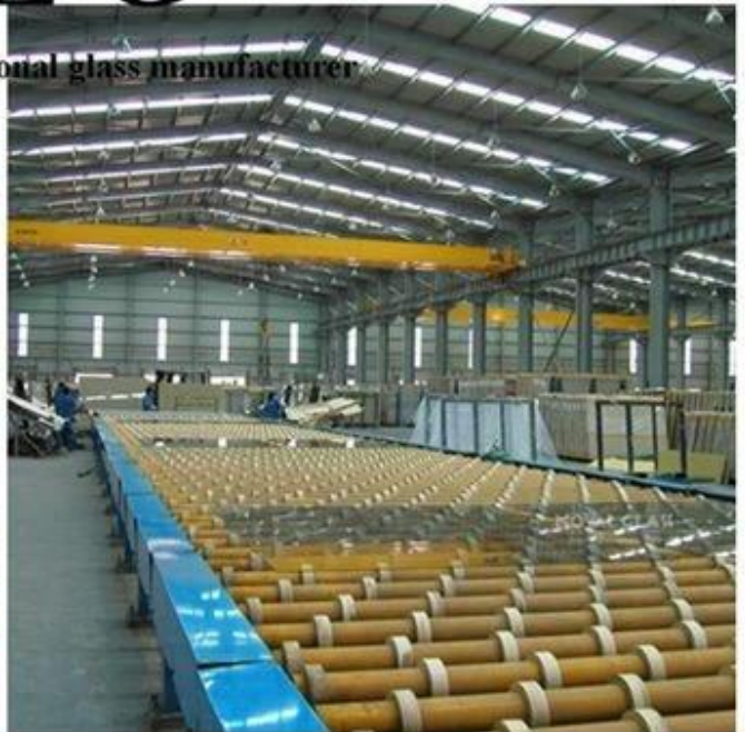
Pakkaaminen ja lataaminen