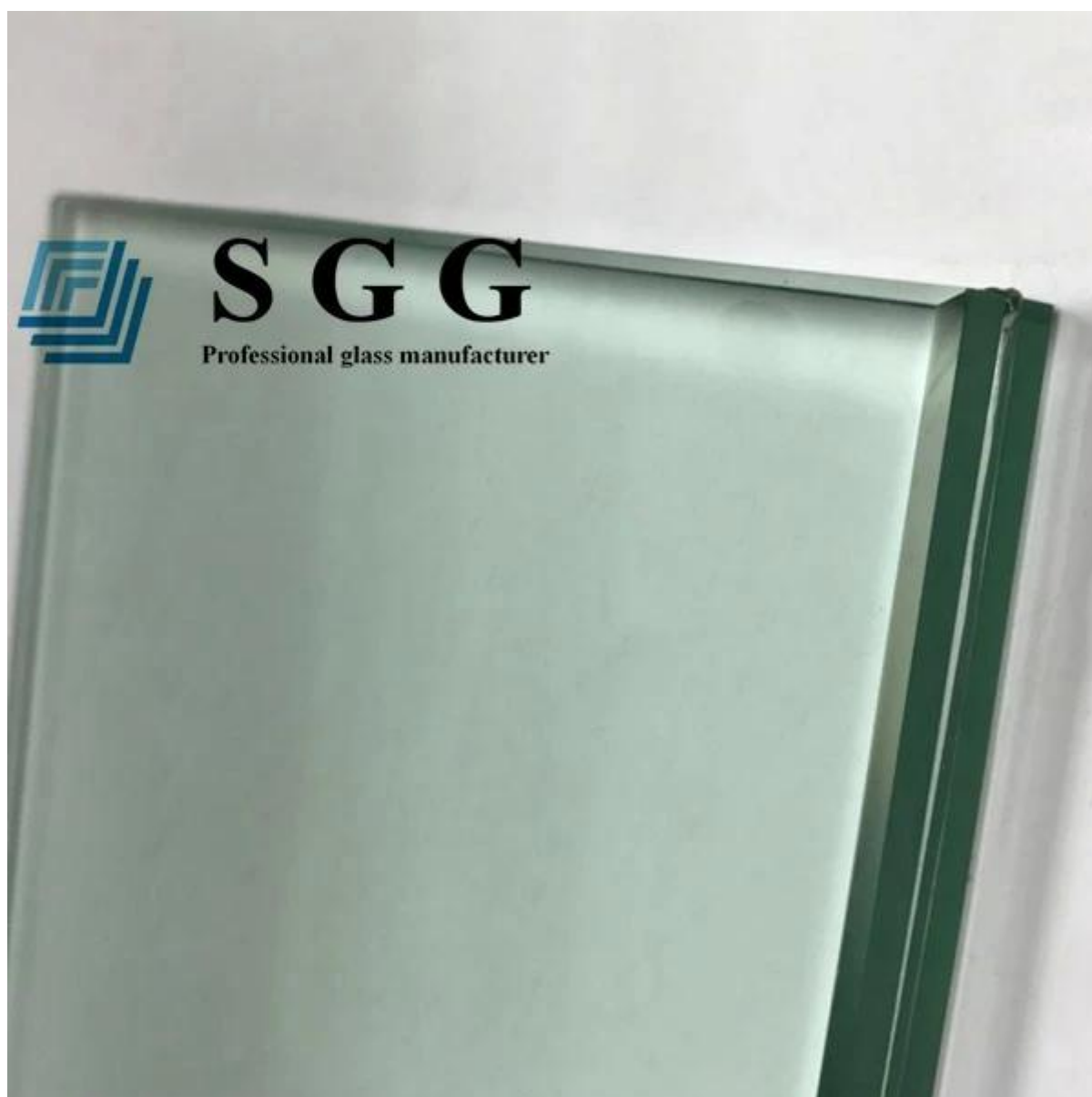
Immagine del prodotto: