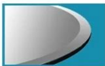
1" BEVELED EDGE