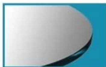
FLAT POLISHED EDGE