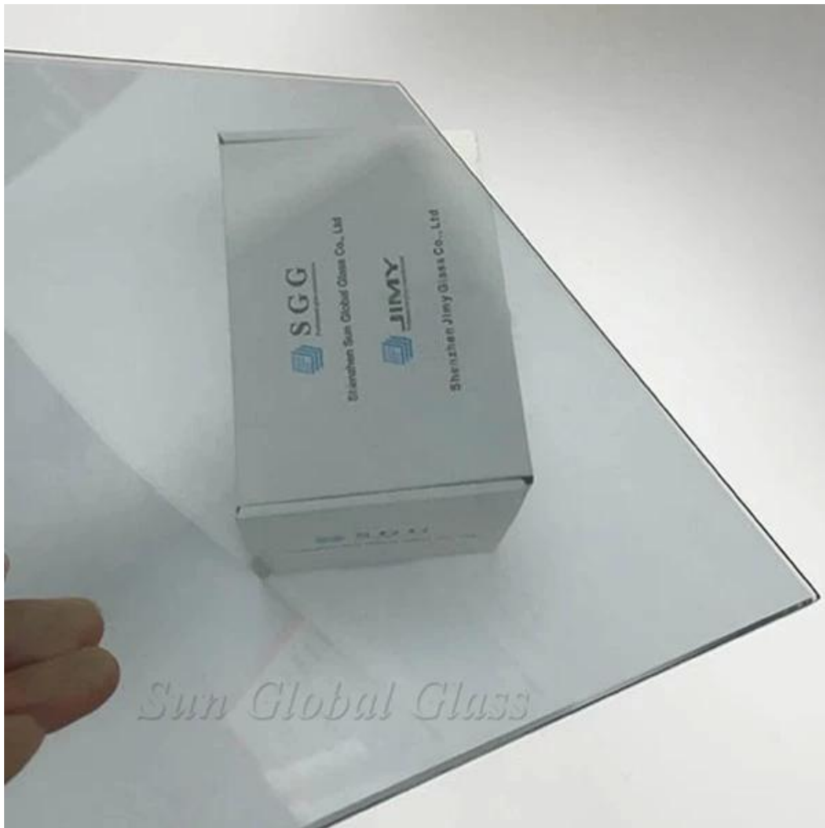
Pacote de Fábrica de China Low-E glass: