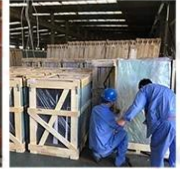
Packing & Loading