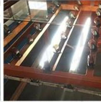
LED Lighting Detection