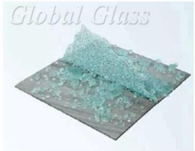
12mm Tempered Glass