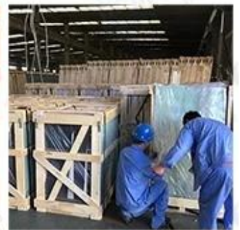
Packing & Loading