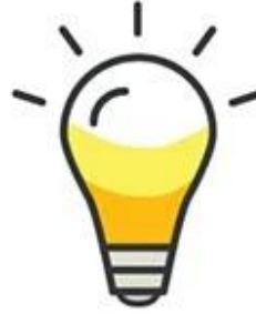
Dimmable LED lights