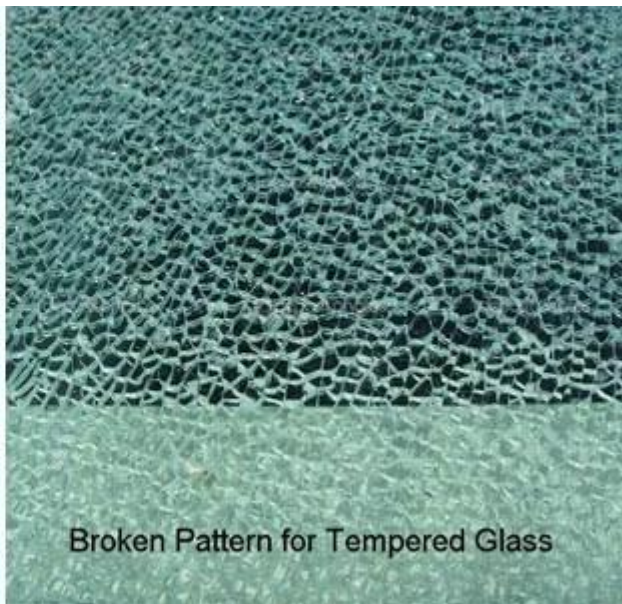
Broken Pattern for Tempered Glass