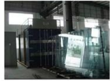
Tempering Inside Tempering Furnace

THE GLASS WALL IS MADE OF 12 MM THICK TEMPERED GLASS WITH 4 SIDES GRINDING AND POLISHING PRECISELY. THE COUNTER SUNK HOLES PUNCHED ON GLASS WITH 8 HOLES.