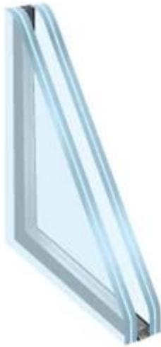
Double Laminated Insulating