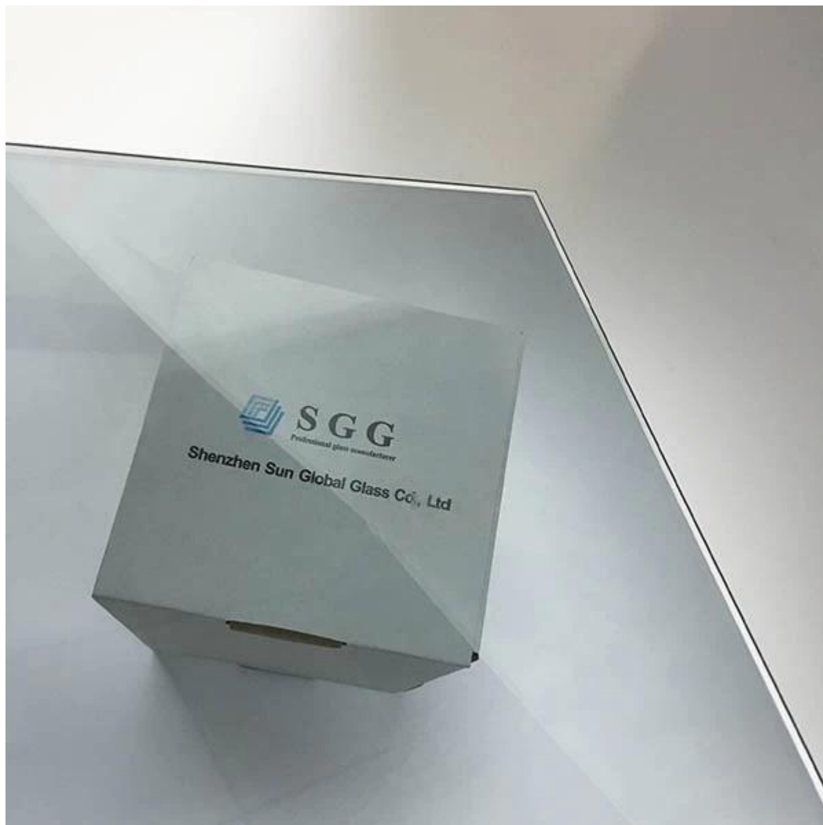
Paket von 10,38 mm low-e laminated Glas: