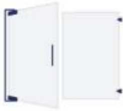
Pivot Shower Doors