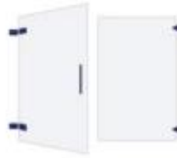
Hinged Shower Doors