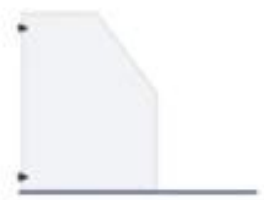
Fixed Shower Doors