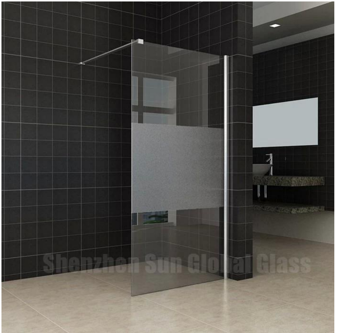
Gerahmter / halbrahmenloser Typ für Badezimmertüren aus 12 mm Milchglas / Sichtschutzglas: