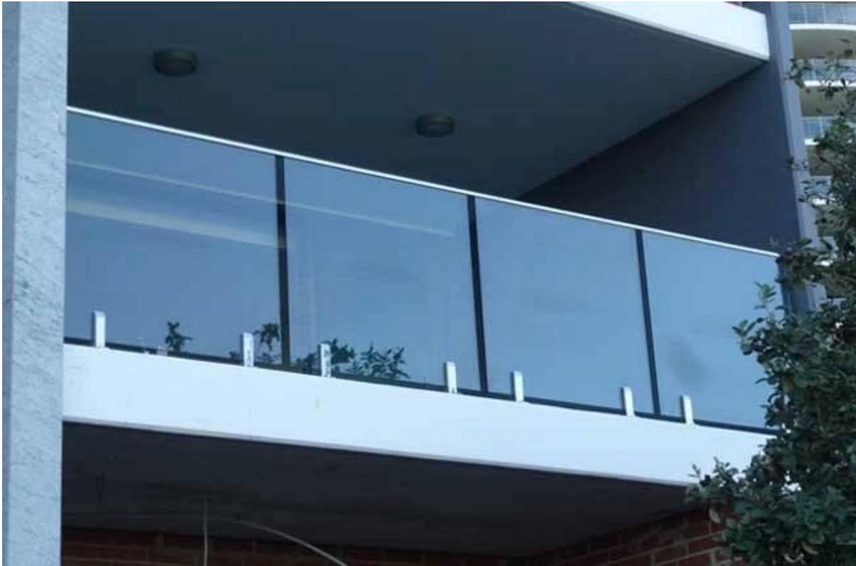
Alle rahmenlosen Glas-Geländer Glas Geländer