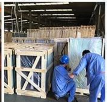
Packing & Loading