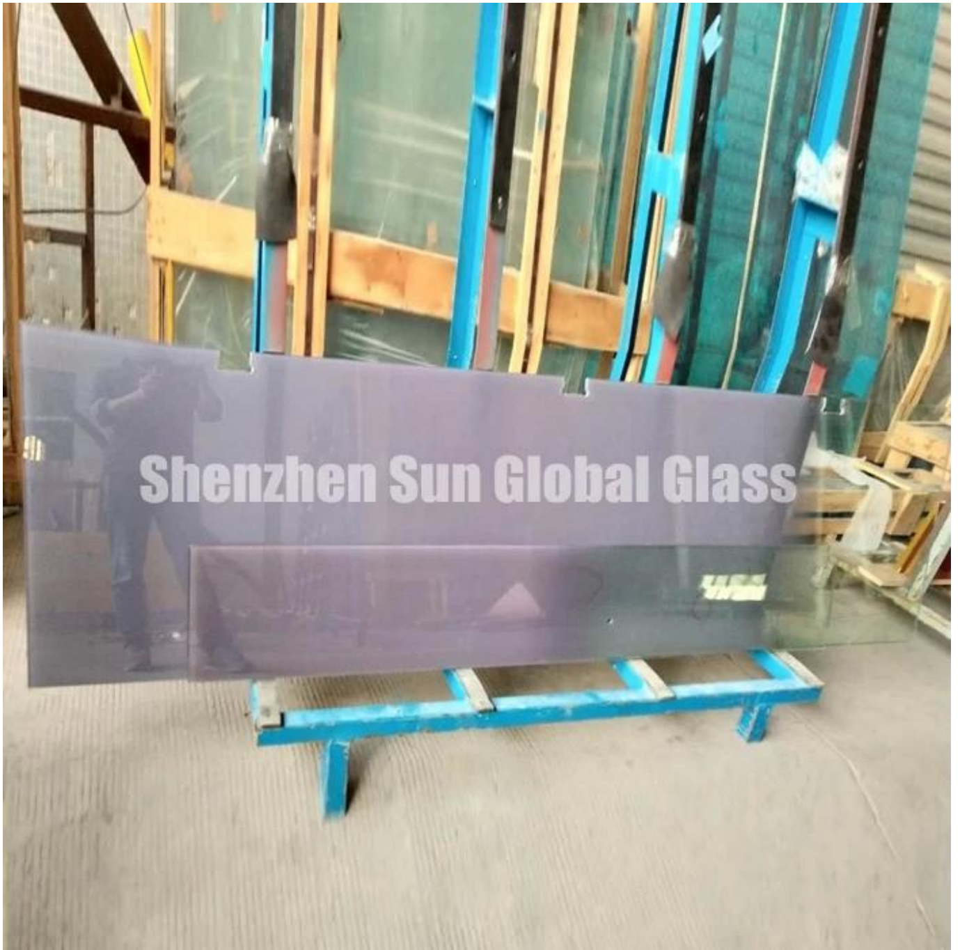
Paket und Laden: