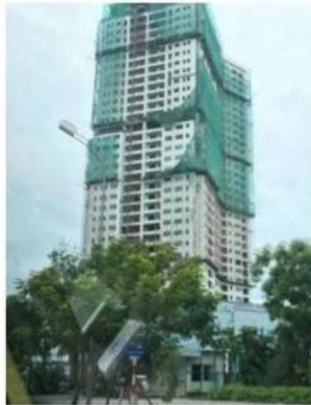
Blooming Tower I Vietnam 16MM Clear IGU 6000m2, 55.4 Clear ESG VSG PVB 4000m2