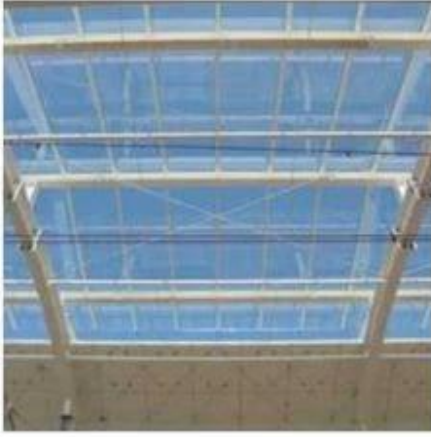
Gliwice Railway Station Poland Project clear ESG PVB 88.2 10000m2