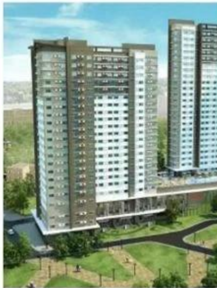
Avida Towers Altura Philippine 6mm clear tempered glass 10mm clear tempered glass 12mm clear tempered glass 20000m2