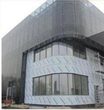
EKO-VIT Łódź Poland Low E tempered Laminated Glass PVB 88.2 3000m2