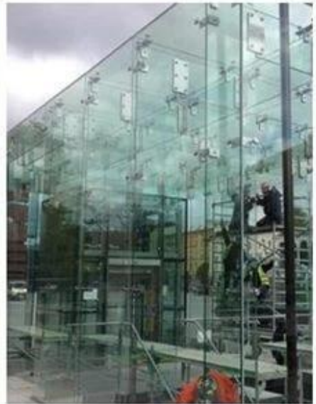
National Forum of Music Wrocław Poland clear ESG VSG PVB 88.2 2000m2