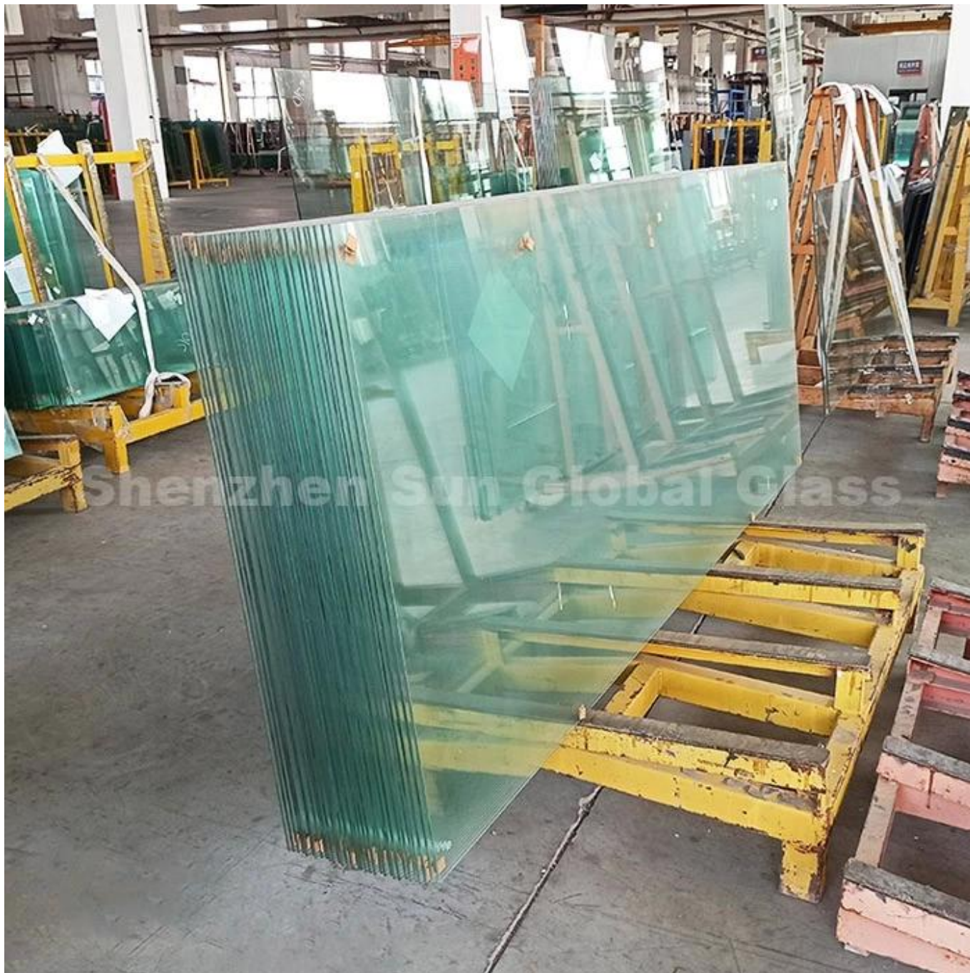
accesorios para la puerta deslizante de la ducha

El vidrio templado de 10 mm se hace generalmente al calentar el vidrio flotado de 10 mm casi a su punto de reblandecimiento y luego enfriarlo rápidamente con aire presionado alto. Esto hace que el vaso casi cinco veces sea tan fuerte como el vidrio tradicional. No solo es resistente al impacto de vidrio templado, también se rompe en piezas pequeñas y circulares. Este efecto desmoronible reduce el riesgo de lesiones graves en caso de que se rompa el vidrio. Otro beneficio es que el vidrio templado es más resistente al calor que el vidrio tradicional, lo que agrega el beneficio de calor aislante dentro de su ducha para una comodidad óptima.