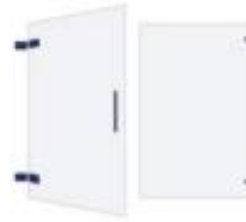
Hinged Shower Doors