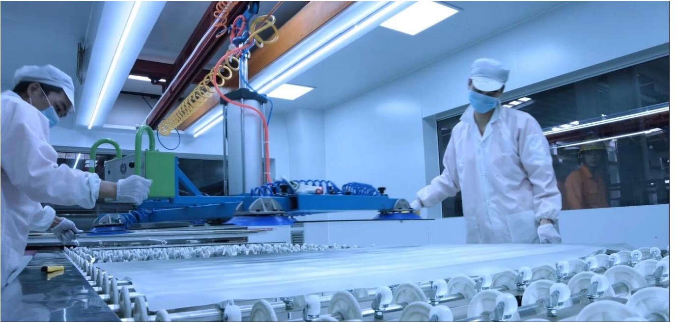
Embalaje y carga de seguridad: