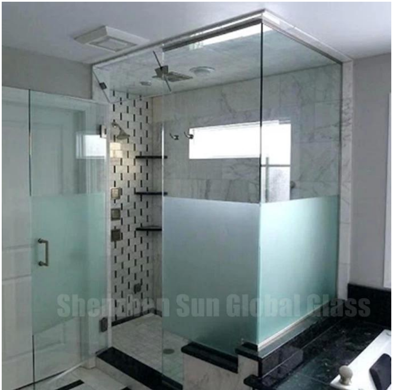
Puertas de baño sin marco para puertas de baño de vidrio esmerilado / de privacidad de 12 mm: