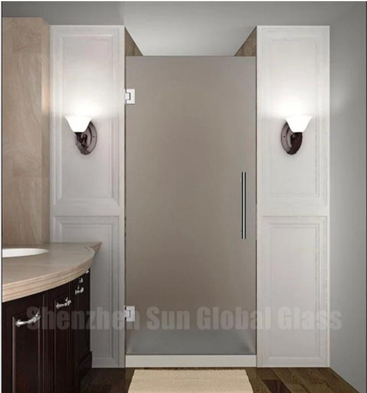
5. Tipo de puerta fija de puertas de ducha esmeriladas de 12 mm / recintos u res