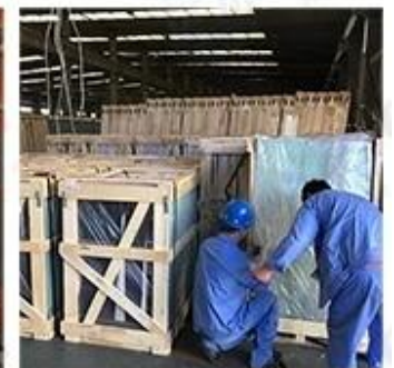
Packing & Loading