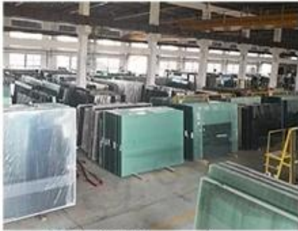
Material Storage Area