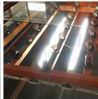
LED Lighting Detection