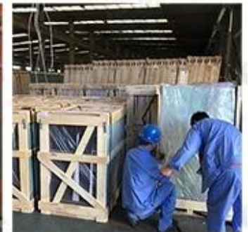
Packing & Loading