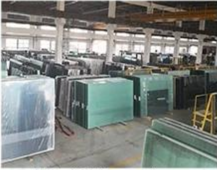
Material Storage Area