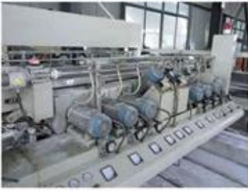
4 Sides Fine Polishing