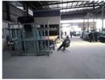
High-pressure & Cleaning