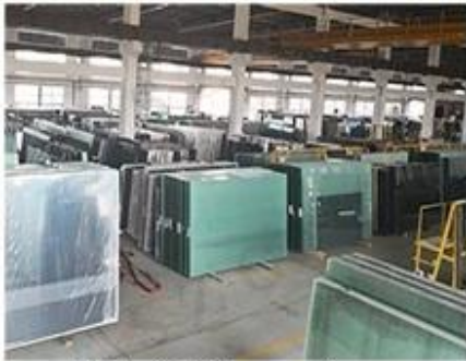
Material Storage Area