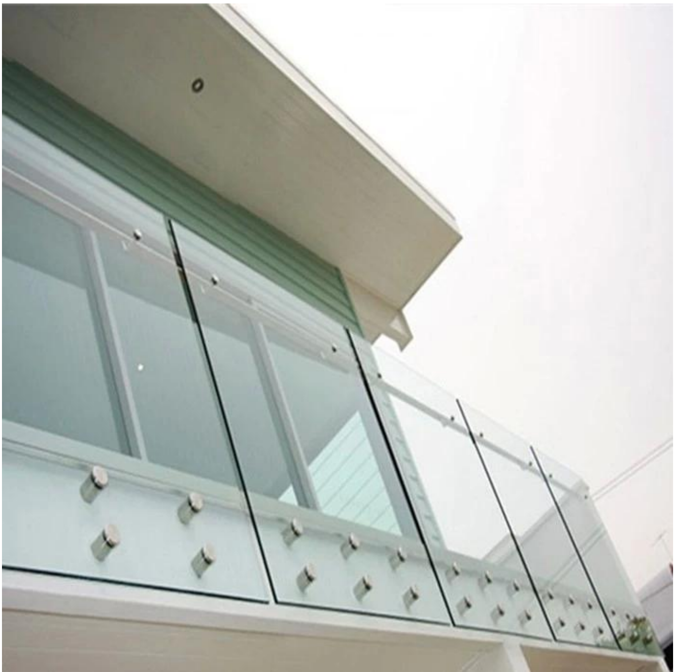
vidrio para barandilla

Una preocupación importante con los propietarios es la durabilidad del vidrio porque lo perciben como frágiles. Sin embargo, las barandillas de vidrio utilizan paneles de vidrio templado y laminado, que son más fuertes que el vidrio regular. El vidrio templado o endurecido es un Vidrio de seguridad porque proporciona seguridad adicional, ya que no se rompe fácilmente, es resistente a los arañazos, y puede soportar temperaturas y presión extremas sin romperse. Además, el vidrio templado no se rompe cuando se rompe, lo que lo hace más seguro.