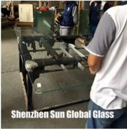
Shenzhen Sun Global Glass