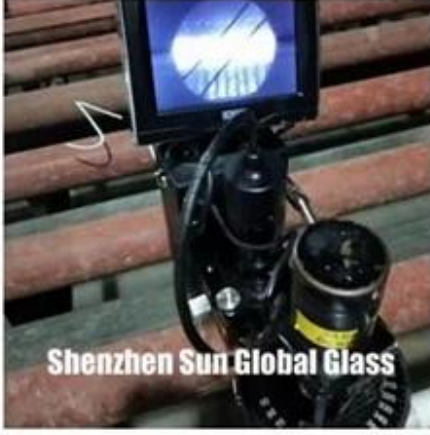
Shenzhen Sun Global Glass