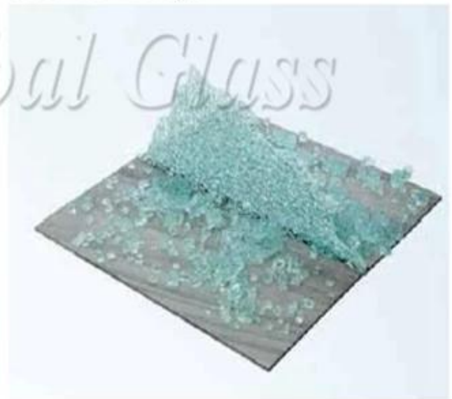
12mm Tempered Glass

On selvää, että Sentryglas Plus -välikerros on hieno innovaatio, josta on tullut erittäin tehokas rakennustekniikka.