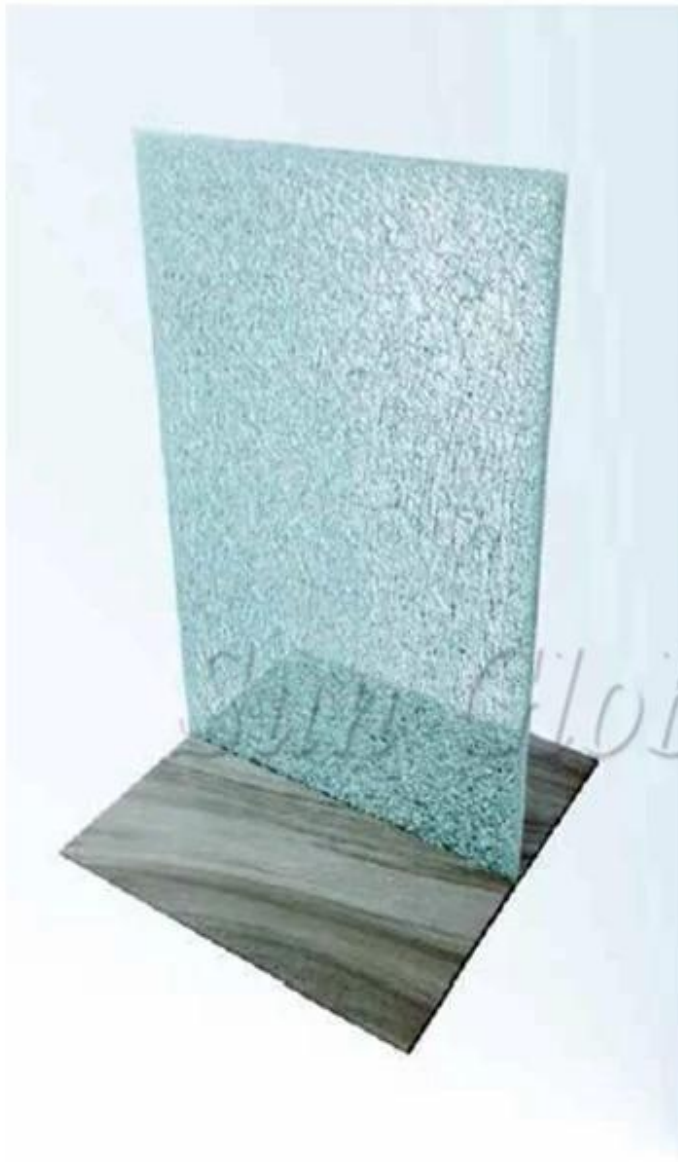
12mm Laminated Glass with 0.060 SGP Interlayer