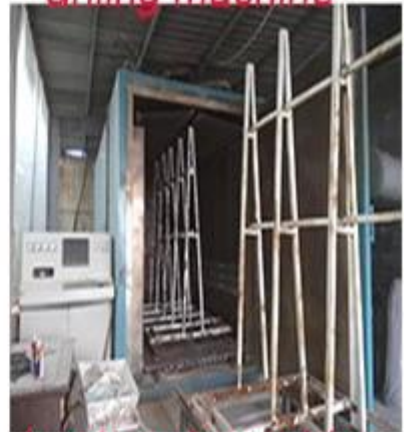
heat soak machine