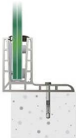
Top Mount 'F'