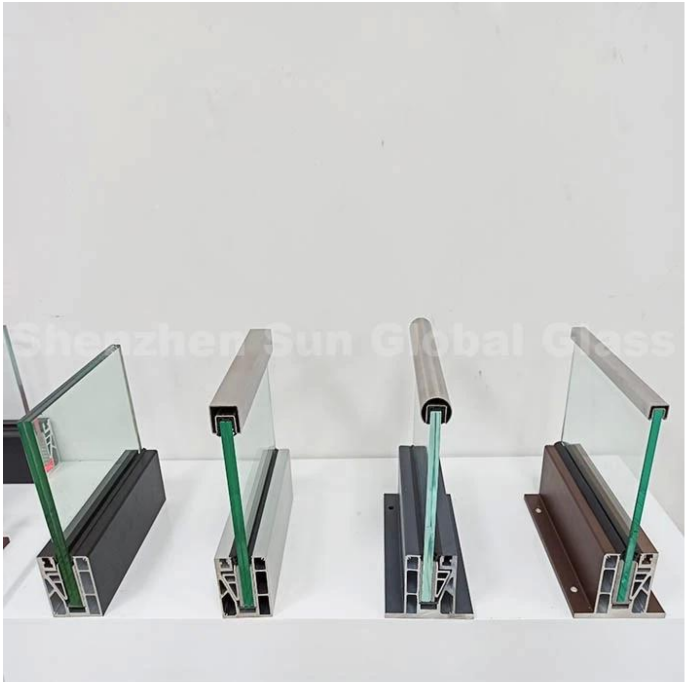
Aluminiumin U-kanavan väri