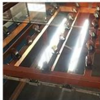
LED Lighting Detection