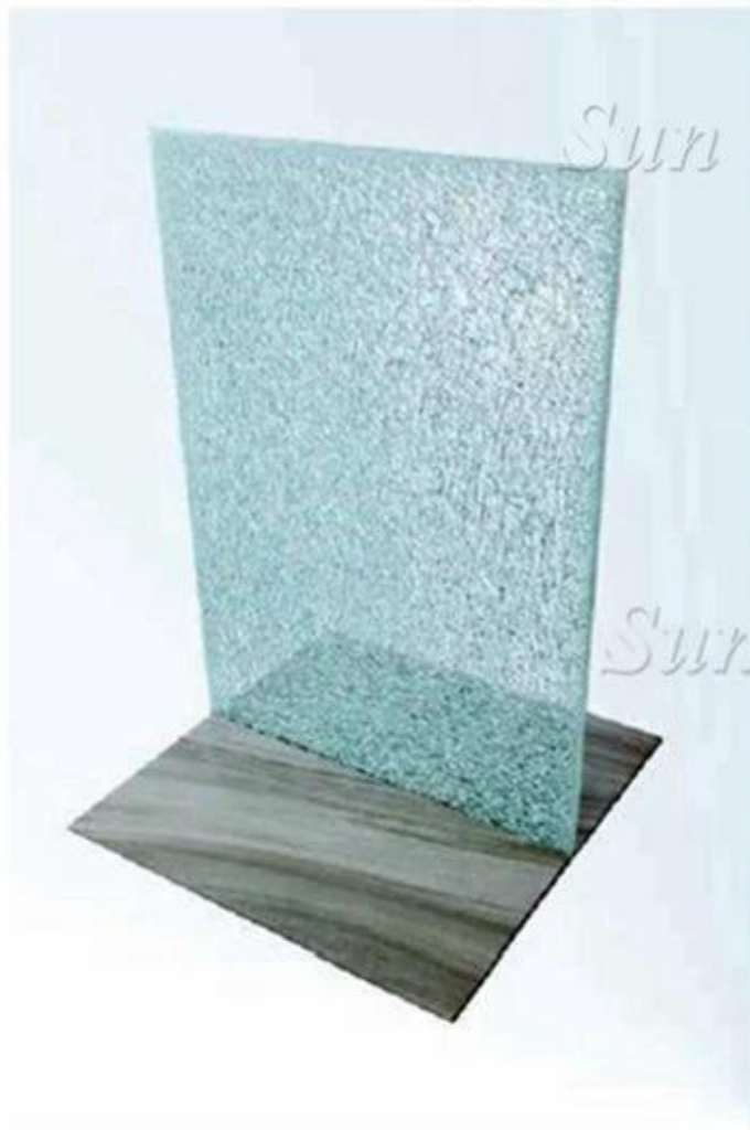
12mm Laminated Glass with SGP Interlayer