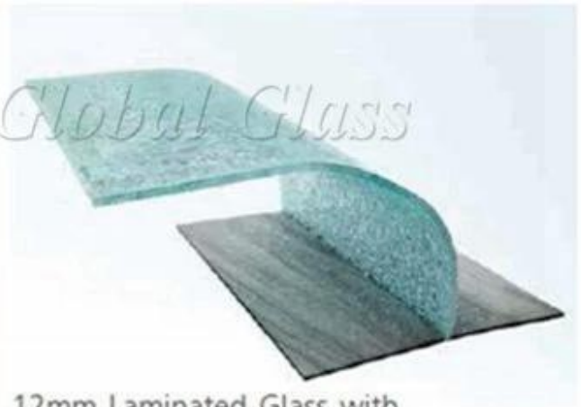
12mm Laminated Glass with PVB Interlayer