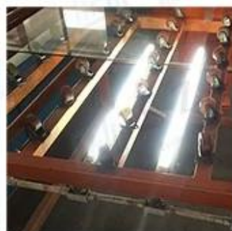
LED Lighting Detection