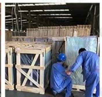
Packing & Loading