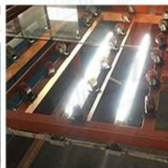
LED Lighting Detection