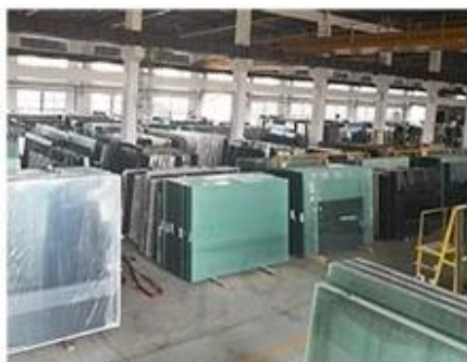
Material Storage Area