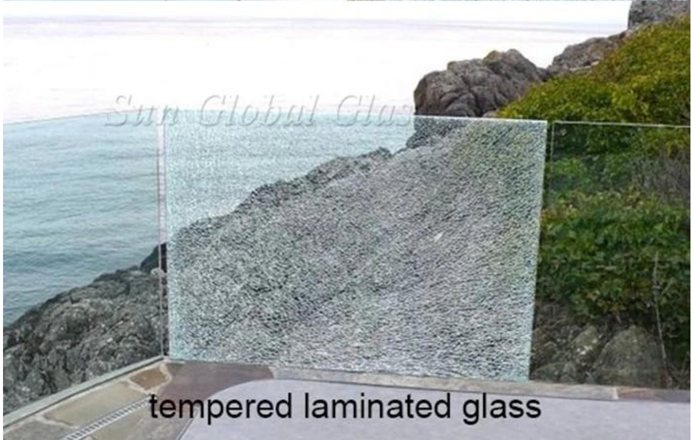
tempered laminated glass