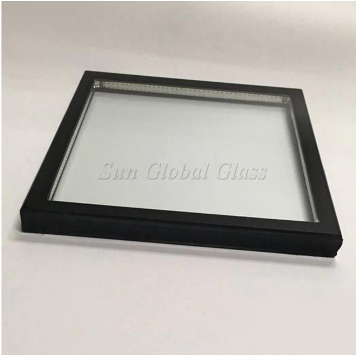
Erittäin kirkas karkaistu kaksoislasitusyksikkö Tuotantolinja: