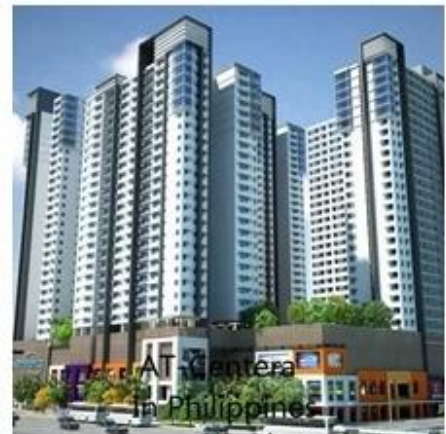
AT Mantera in Philippines