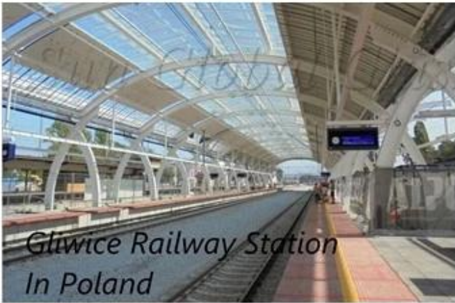
Gliwice Railway Station In Poland