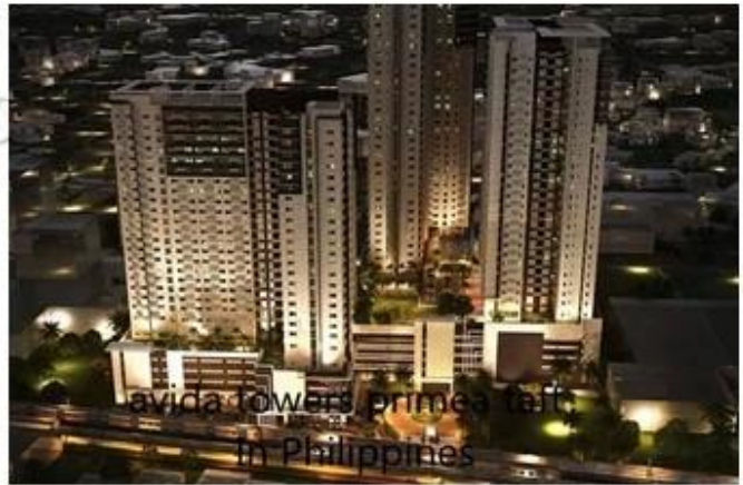
Avicorp towers, primea tall in Philippines