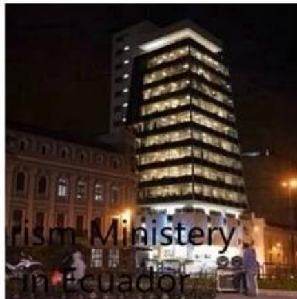
Tourism Ministry in Ecuador