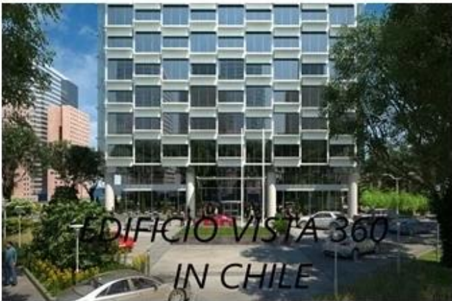
EDIFICIO VISTA 360 IN CHILE