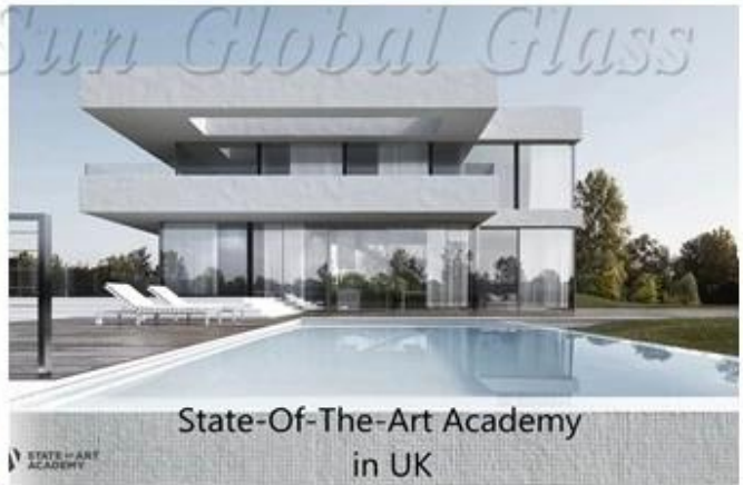
State-Of-The-Art Academy in UK