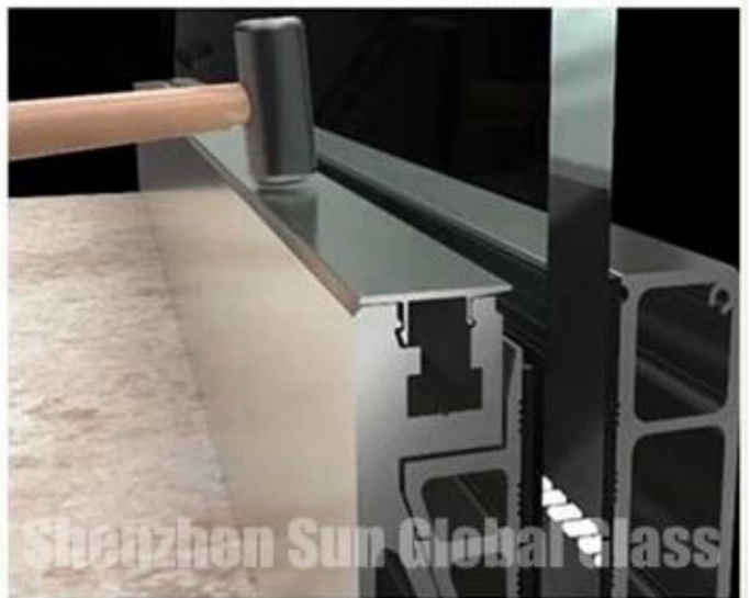
put the top cover over the screw