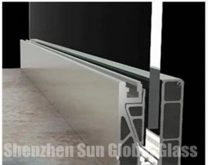
install the tempered or laminated glass