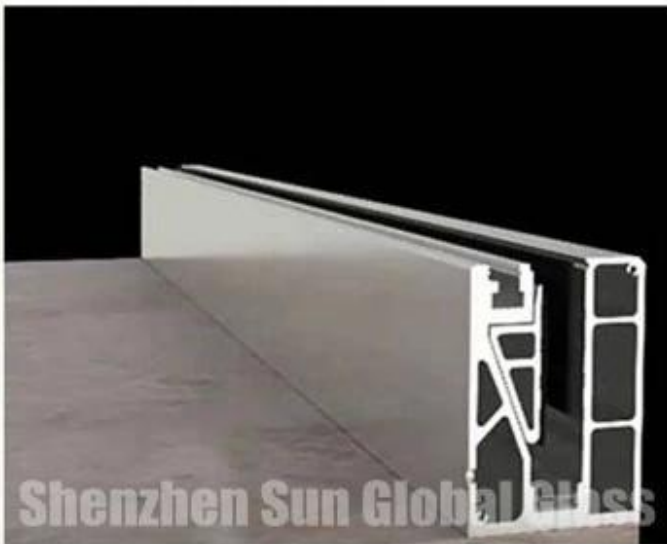
install glass pad