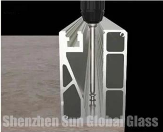
screw the aluminum groove to the floor and drill the drain hole