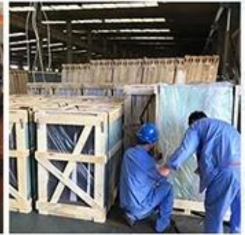
Packing & Loading