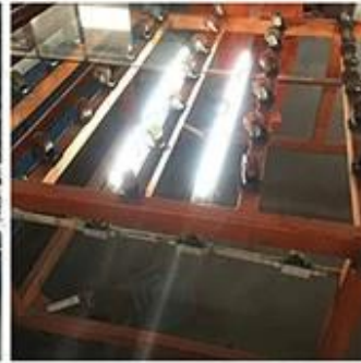
LED Lighting Detection