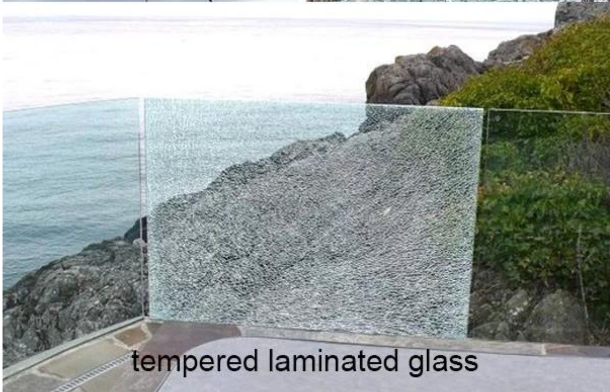
tempered laminated glass