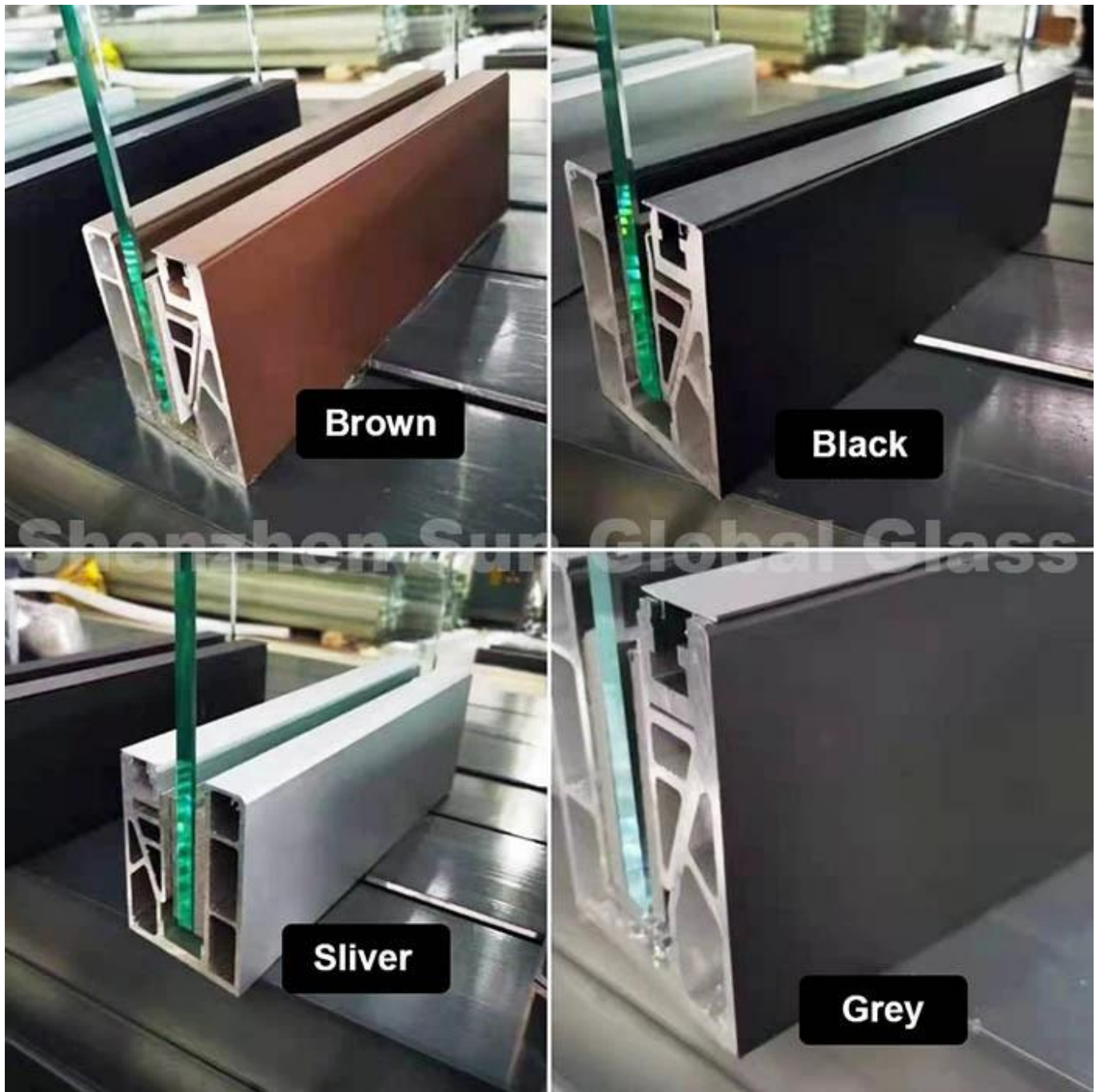
Canal U en aluminium avec lumière LED