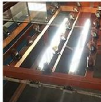
LED Lighting Detection