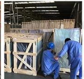
Packing & Loading