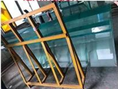
product come out