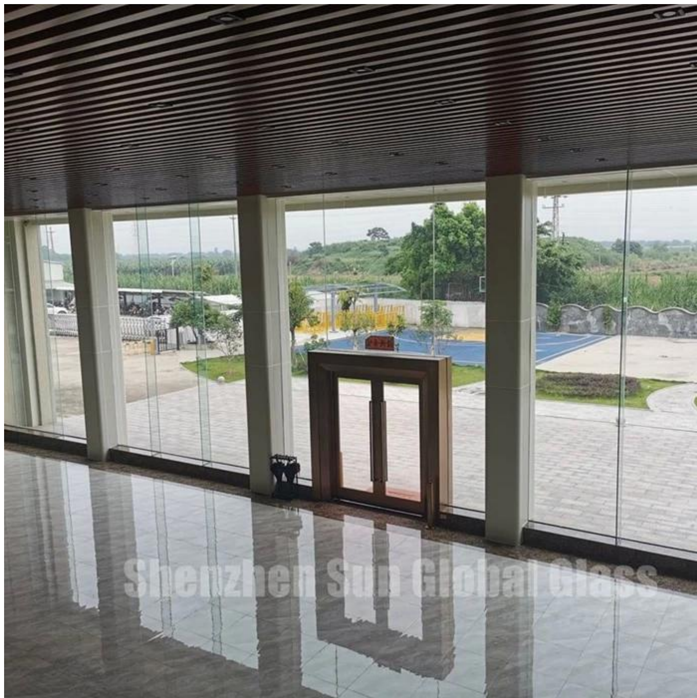
Images d'un échantillon de verre feuilleté trempé à faible teneur en fer: