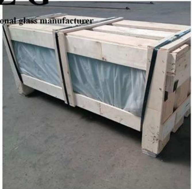
Emballage en verre feuilleté trempé incurvé SZG