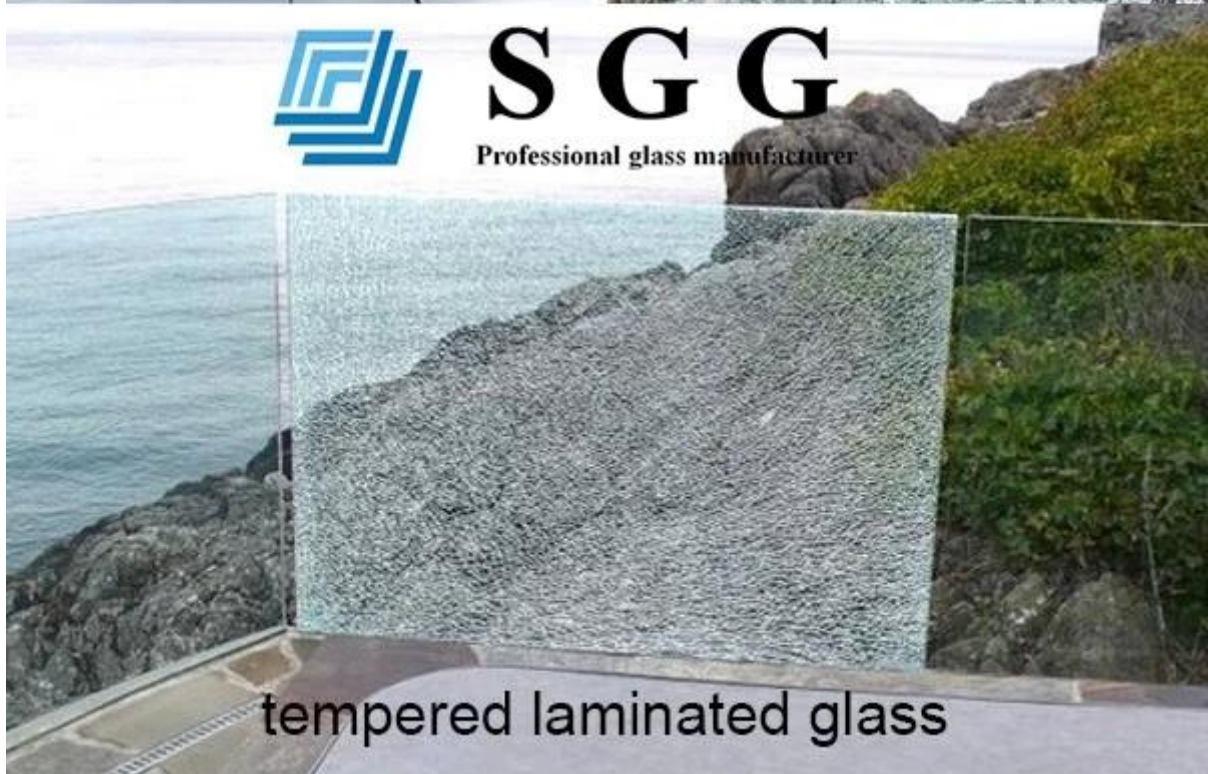
tempered laminated glass