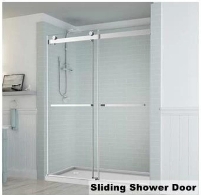
Sliding Shower Door