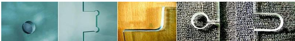
Bris de verre feuilleté trempé: